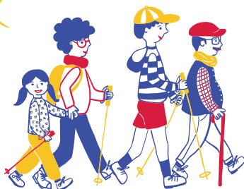
Ilustración: Gemma Terol

Orden Hospitalaria de San Juan de Dios Provincia de España