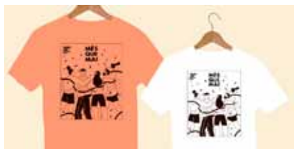
Il·lustración: Judit Canela