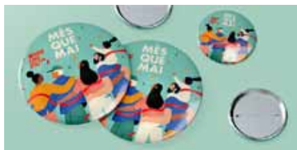
Il·lustración: Judit Canela