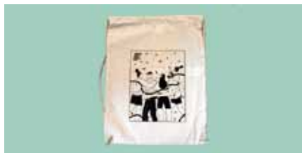
Il·lustración: Judit Canela